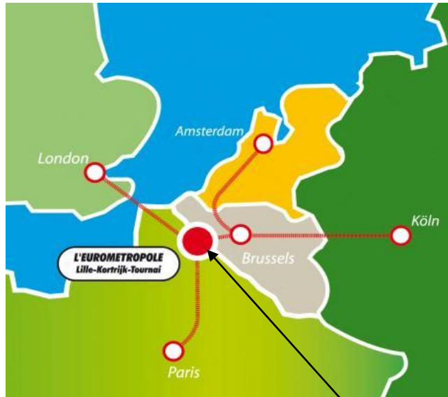
Doc 5b et c : Coopérations interrégionales européennes, Eurométropole et Eurorégions Transmanche (G-B/Fr) et Nord (Fr / B.)