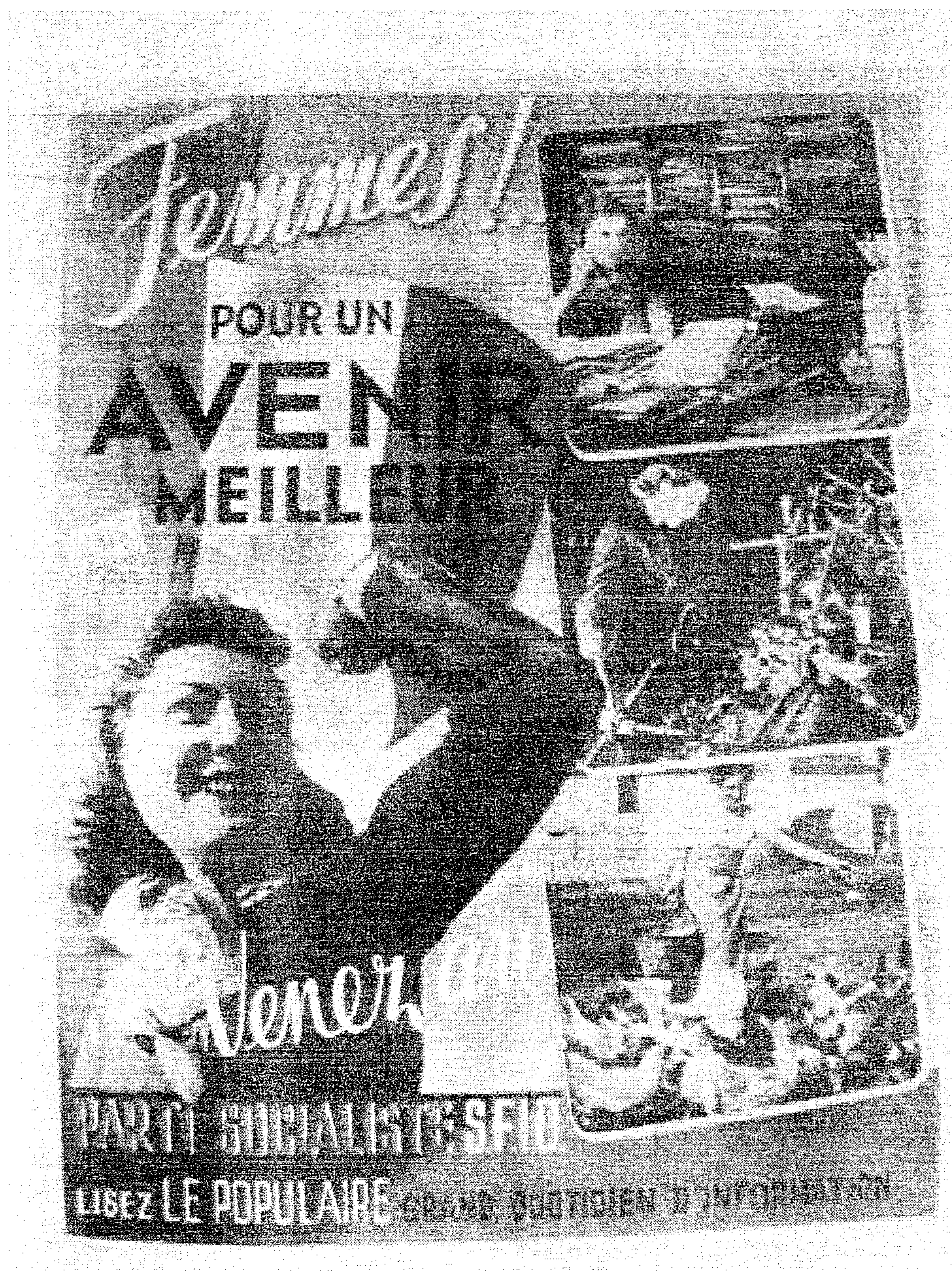
Source : Affiche éditée par le Parti Socialiste SFIO (Section Française de l'Internationale Ouvrière), 1945